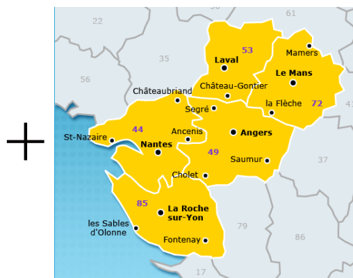
Pays de la Loire